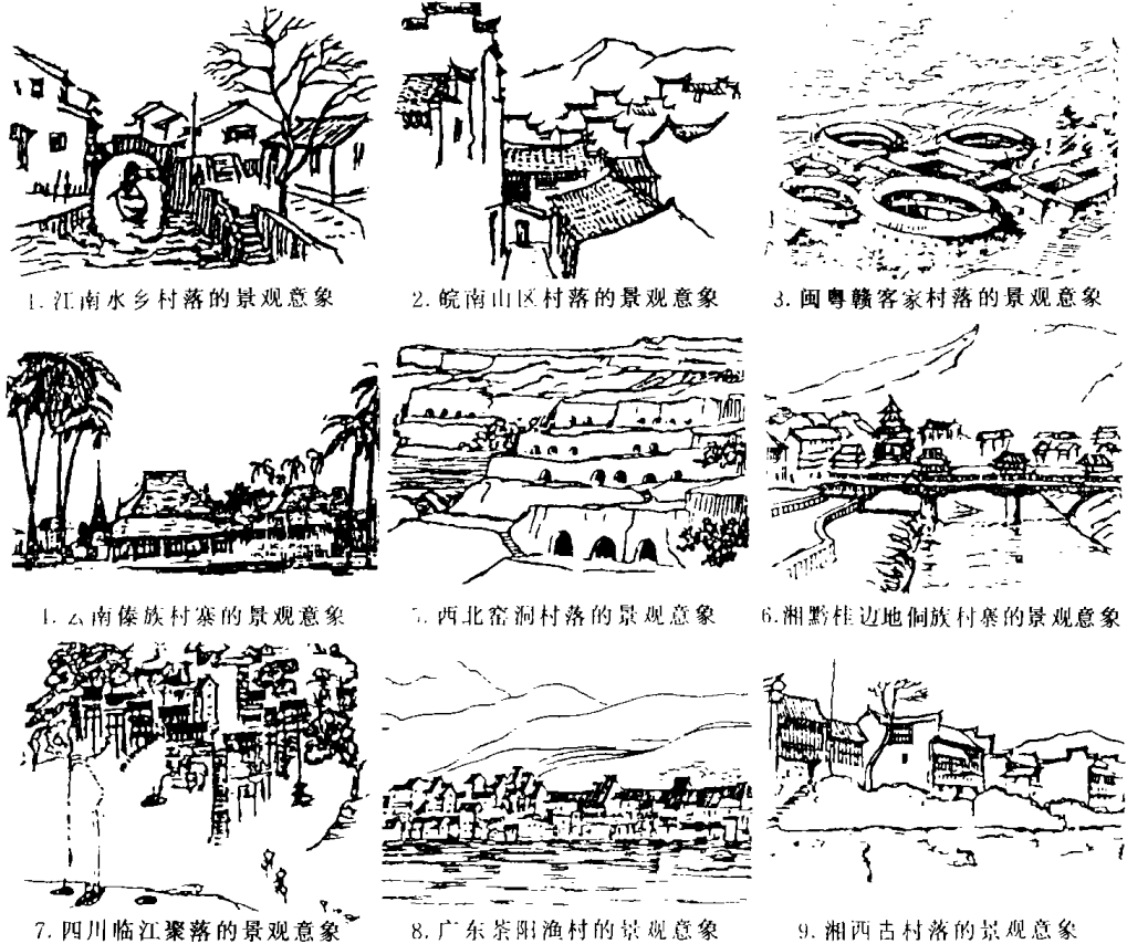
1. 江南水乡村落的景观意象 2. 皖南山区村落的景观意象 3. 闽粤赣客家村落的景观意象 4. 云南傣族村寨的景观意象 5. 西北窑洞村落的景观意象 6. 湘黔桂边地侗族村寨的景观意象 7. 四川临江聚落的景观意象 8. 广东茶阳渔村的景观意象 9. 湘西古村落的景观意象

闽粤赣三省交界地区，是客家人的主要聚居地，这里山高水长，田地稀少。历史上，当由北而南迁的大批汉民为躲避战乱来到这里时，只好在这片未开垦的山地中聚族而居。为