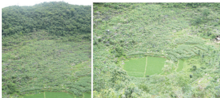
图 1 峰丛洼地林-灌植被及耕地景观

喀斯特峰丛洼地景观格局的变化主要表现为植被覆被的变化,植被覆被变化是由植被-土壤-表层岩溶水循环系统的稳定性决定的,其中表层岩溶水循环及降水产流模式的稳定性至关重要。