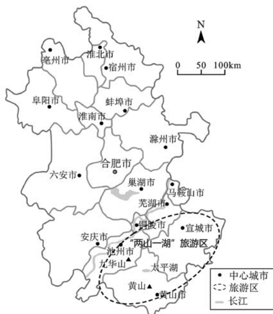
图3 安徽省单一板块旅游空间格局

宏儒(宏村、儒村)公路(2004年)连接了黄山、西递—宏村两处世界遗产,宣广高速等交通设施的建设加强了旅游节点之间的空间联系。高级别旅游节点在空间上高度集聚和不断完善的旅游交通网络,促进了安徽省旅游空间格局由黄山、九华山的点状格局向“两山一湖”旅游区板块格局的发展(图3)。在旅游经济市场化过程中,市场主体由单一向多元化发展,地方政府为缓解旅游建设基金的不足,制定多项产业政策措施引导和激励其他市场主体投资旅游建设行为,2005年,安徽省政府印发《关于促进“两山一湖”地区旅游产业发展若干政策》,在很大程度上刺激了不同所有制投资主体为了获得潜在利润而掀起的投资景区和旅游接待设施的热潮,2006~2012年,“两山一湖”地区A级景区开发共69处,其中,其他所有制投资主体开发52处,占75%。这一时期,政府和民间资本共同成为旅游开发建设的主导力量,但投资开发重点各有不同,政府加大财政投入,以改善旅游交通条件为重点,逐步完善旅游基础设施,优化投资环境,民营资本等市场主体重点投资景区(点)及旅游产业设施,区域内旅游节点数量明显增加,产业设施逐步完善。在高品味、高集聚的旅游资源和密集性旅游政策的叠加效应下,“两山一湖”旅游区旅游业得到长足发展,不断促进区域旅游空间格局由点状向板块发展演化,这一阶段,政策对旅游空间结构