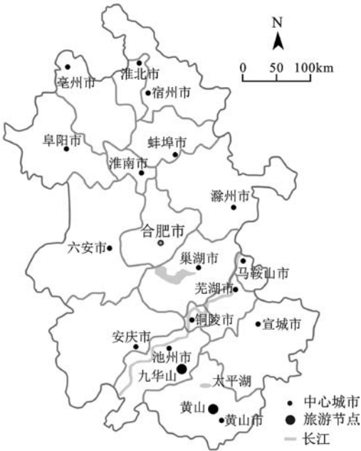
图2 安徽省点状旅游空间格局

黄山、九华山的快速发展,带动周边具有发展潜力的城镇和景区,周边地区旅游资源禀赋突出、区位条件较好的旅游节点如西递-宏村、屯溪老