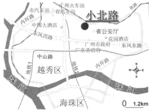
图 1 小北路区位示意图

调研的主要地域空间范围为越秀区洪桥街道的小北一带。在小北一公里半径内分布着诸多聚居黑人客商的中高层商住楼, 典型如天秀大厦、秀山楼、陶瓷大厦、国龙大厦等, 仅秀山楼、天秀大厦、国龙大厦三栋就聚集了 400 多名黑人居民(街道访谈, 2007-3-16), 其中天秀大厦更是几乎无人不知。调研表明, 1997 年左右黑人客商开始由东南亚迁来广州, 随即在小北一带呈聚居之势, 其原因部分在于小北临近火车站、广交会原会场和诸多批发市场的区位优势, 部分原因在于最早迁来广州的香港客商即选在天秀大厦开店经营(访谈资料)。因此, 本文将调查范围锁定在小北路周边的若干居住区, 详细的区位关系见图 1、图 2。调查共三个阶段, 分别是 2007 年 3 月、2008 年 4 月和 5 月。2007 年 3 月以天秀大厦为访谈点, 共访谈 46 位黑人居民, 2008 年 4 月以本地居民为对象进行问卷调查, 2008 年 5 月 30 日对五位非洲社团领袖进行了一次焦点群体 (focus group) 访谈 ② 。在此期间同时收集整理