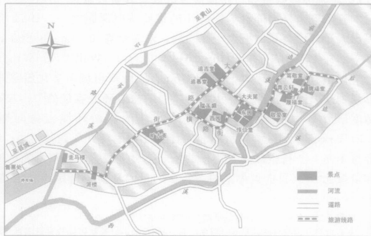
图 1 西递主要旅游景点示意图

本文分析中, 西递游客接待统计资料来源于黟县旅游局, 日内客流时分布、相关游览面积 (特指游客可以自由站立的地面面积)、旅游路线长度、居民感知和游客感知等资料均来自于实地调查。第一次调查为 2002 年 7~8 月, 入户发放居民问卷 150 份, 回收有效问卷 134 份, 在敬爱堂和追慕堂二个景点随机发放游客问卷 250 份, 回收有效问卷 236 份, 进行了日内客流时空分布、相关游览面积和旅游线路长度的实地量测, 走访了相关部门和人员, 收集了大